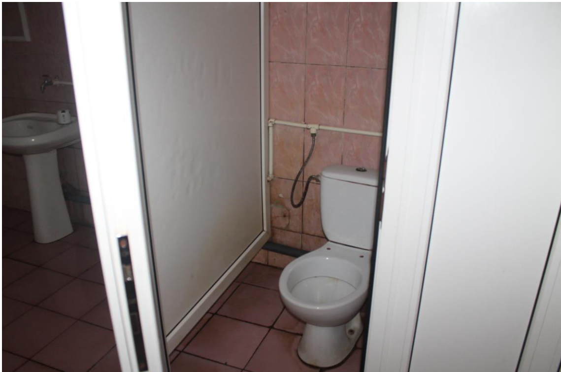
Foto din blocurile sanitare

Spațiile wc sunt delimitate prin separeu și uși, însă chiuvetele nu au capac. În baia comună persistă umezeală, inclusiv din cauza ventilației reduse. Dușul este organizat în aceeași încăpere a băii comune.