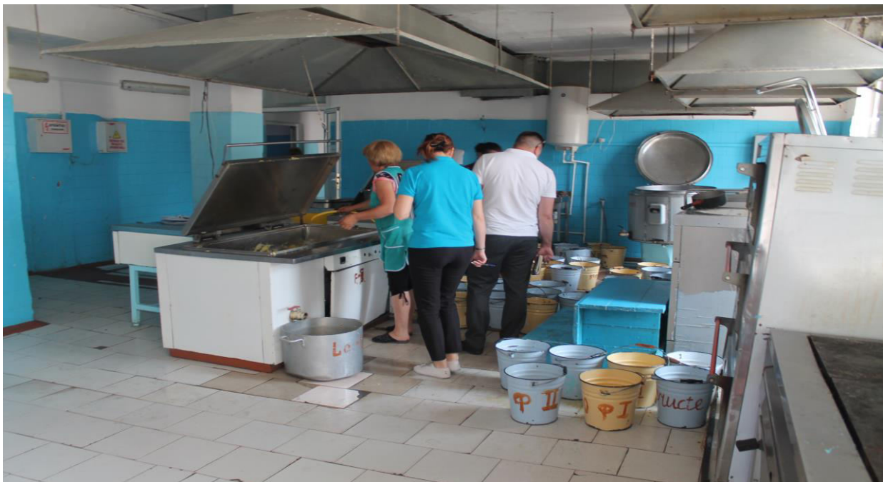
Foto încăperi ale bucătăriei