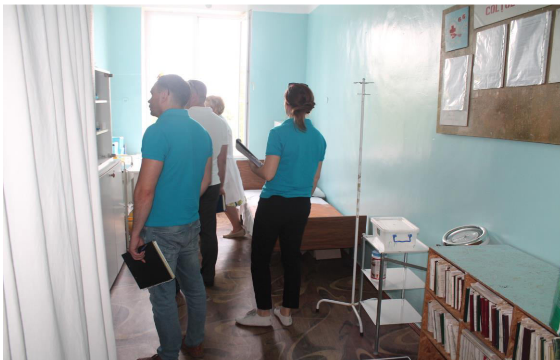
Foto cabinetul de proceduri

La fel, din 10-15 cartele medicale ale beneficiarilor verificate, s-a observat că acordurile de pe prima pagină erau la toți semnate cu datele 14.04.19 sau 15.04.19 (acord pentru tratament terapeutic, tratament indicat de medicul psihiatru, iar în una era semnat acordul pentru vaccina antigripală), fapt ce ar demonstra că aceste acorduri nu se i-au în fiecare caz aparte la necesitate.