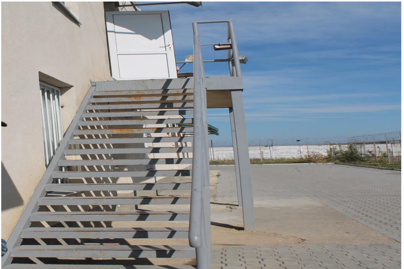
Foto_OAP_Accesul spre serviciul medical_09.10.2019

Serviciul de asistență medicală este asigurat prin activitatea 8 ore în zi a șefului serviciului medical și a asistentului medical. Din cauza deficitului de personal, serviciul de gardă nu este organizat. Medicii psihiatru activează 2 - 3 zile în săptămână.