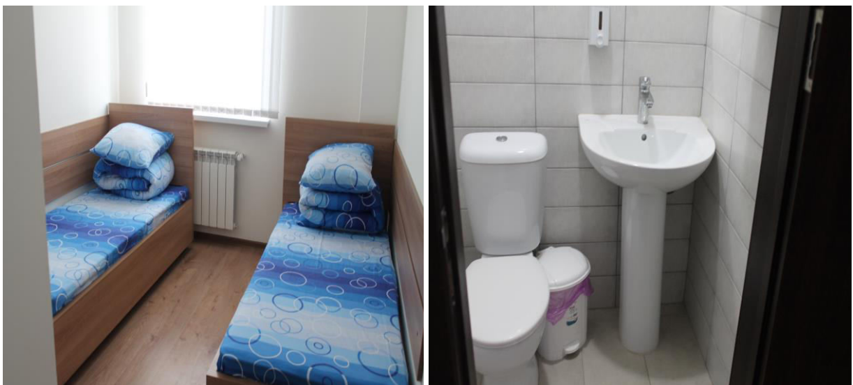
Foto_OAP_PTF Palanca_spațiu izolator_24.06.2020