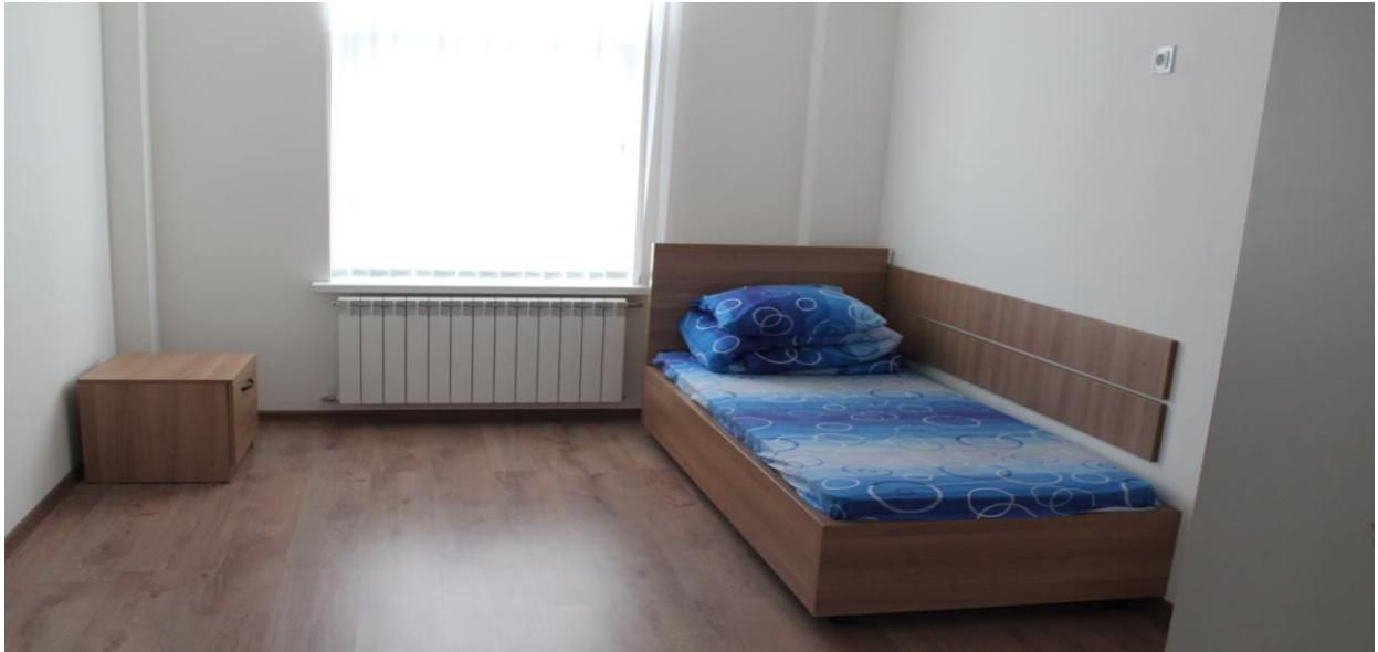
Foto_OAP_PTF Palanca_spațiu solicitanti de azil_24.06.2020