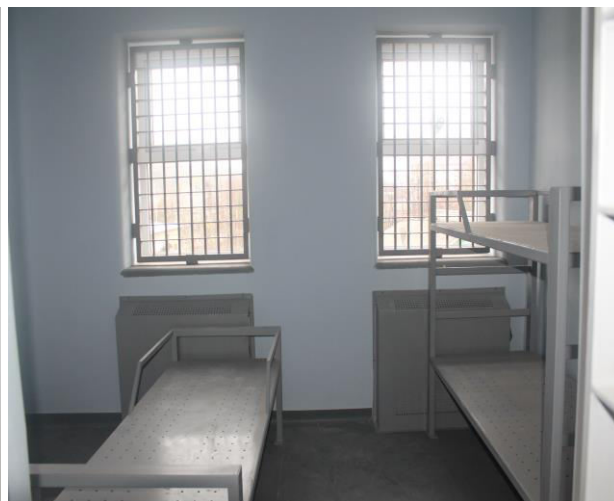
Foto_OAP_izolator IP Anenii Noi în reparație_30/11/2020