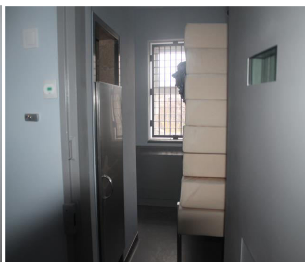
Foto_OAP_izolator IP Anenii Noi în reparație_30/11/2020