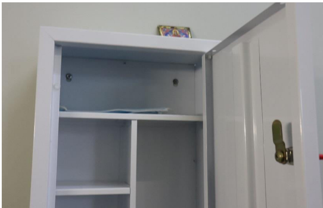
Foto OAP_IDP Hîncești_trusă medicală

Cu toate acestea, examinarea medicală a persoanelor deținute nu se face la fiecare intrare/ieșire din izolator , iar documentația medicală nu este completată corespunzător. Echipa de vizită a constatat că cabinetul medical este încuiat, iar în sala de proceduri există trusă medicală de urgență, însă fără medicamente.